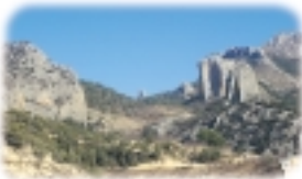
Collado de Sanchet

También caminaremos cerca de otro monte más pequeño, el Cabal, después de ascender unas empinadas cuestas que nacen en su falda. Una vez que hemos alcanzado un punto cercano a la cima, miramos hacia el Este para contemplar un magnífico paisaje, pues nuestra vista abarca gran parte de la depresión sobre la que se asienta la Marina Baixa, por la que discurren los ríos Algar y Guadalest; el casco urbano de Polop en primer término; y, al fondo, el Penyal d'Iñach y el mar. En todo este tramo de la ruta vamos a encontrar una vegetación bastante homogénea, con formaciones más o menos densas de pino carrasco, acompañadas en el estrato de sotobosque por especies de matorral, arbustos y herbáceos como el romero, la jara, la coscoja, el brezo y el llistó. También apreciamos la presencia de vestigios de los antiguos cultivos que ocupaban la zona, de los cuales se pueden ver todavía banales en los que se conservan algarrobos, olivos y acebuches. Entre esta vegetación llegamos a la Casa de Dios, que está prácticamente en ruinas, después de dejar atrás otra construcción en muy precarias condiciones.