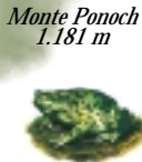
Monte Ponoch 1.181 m