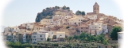
Pueblo de Polop

encontraremos una barrera que corta el paso, debemos seguir aunque esté puesta. Con frecuencia se suele ver en la zona algún monje budista, puesto que en las proximidades hay un templo dedicado a este culto. Si les saludamos ellos responderán probablemente con una reverencia. Más adelante nos cruzaremos varias casas agrícolas que en la cartografía se les denomina, de forma conjunta, les