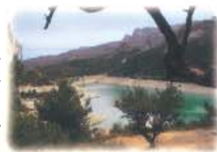
Embalse de Guadalest