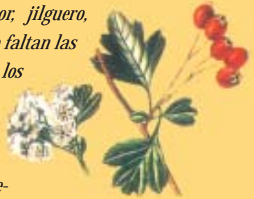
Cerezo de Pastor