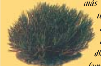
Cojín de Monja

Está constatada la presencia en la zona de aves rapaces como el cernícalo, el halcón y las águilas, además de algunas especies nocturnas (búho y mochuelo). En estos parajes son muy abundantes las perdices, cuya procreación se fomenta mediante pequeños cultivos de gramíneas (trigo fundamentalmente) en distintos puntos de la umbría. Dependiendo de la época del año podemos contemplar una gran variedad de aves de pequeño tamaño o paseriformes (colirrojo, ruiseñor, jilguero, verdecillo, etc). No faltan las palomas torcaces, los grajos, las chovas y los cuervos. De los reptiles, difíciles de ver las culebras y lagartos ocelados. Si tenemos suerte podremos cruzarnos en nuestro camino algún jabalí. Mucho menos habituales son los encuentros con mustélidos como las comadrejas, tejones y ginetas, aunque siempre cabe la posibilidad de detectar su presencia por las huellas y restos que dejan a su paso. En la ruta también habitan algunos erizos.